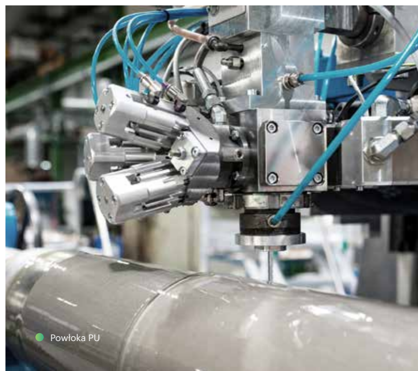
● Powłoka PU