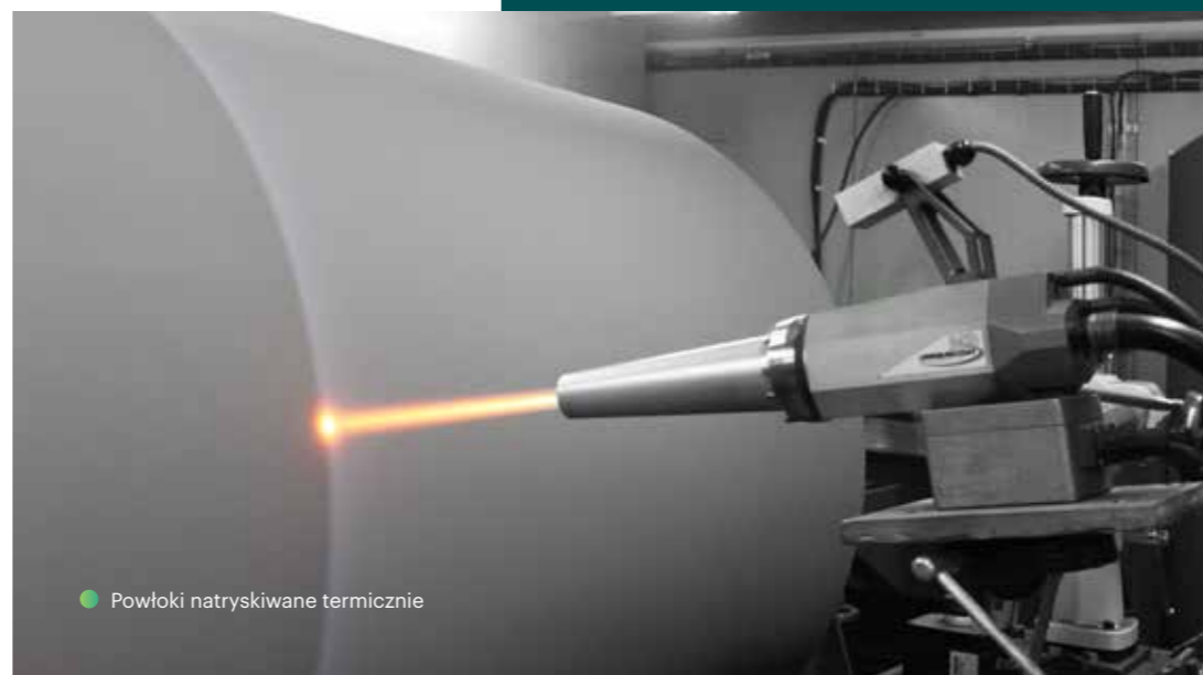
● Powłoki natryskiwane termicznie