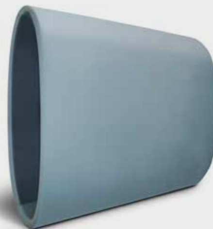
Gumowe pasy do wykurczania tkanin