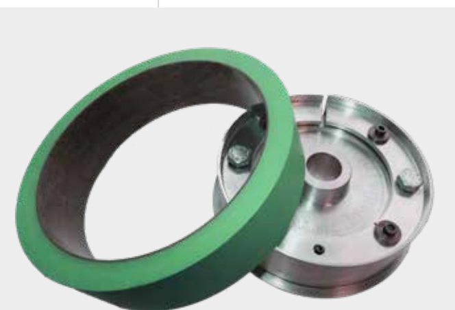
● HandySleeve® + HandyBase

Firma Hannecard opracowała HandyCoat®, rewolucyjny system powlekania puszek, aby sprostać potrzebom, wymaganiom i coraz większym wolumenom produkcji w tym przemyśle. Nasz unikalny system zapewnia szybką i skuteczną metodę nakładania powłok na puszki aluminiowe, oferując znaczną oszczędność czasu i kosztów.