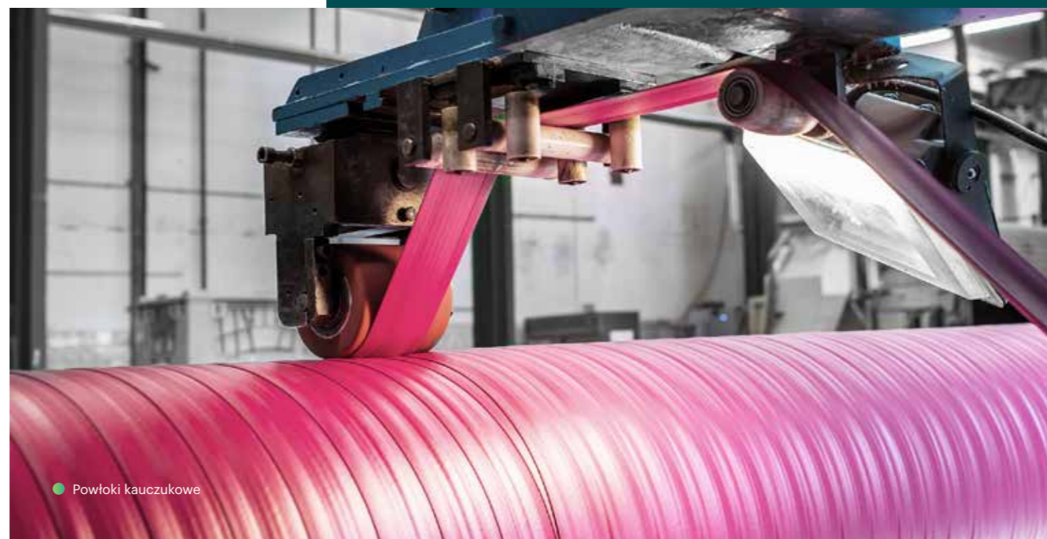
● Powłoki kauczukowe