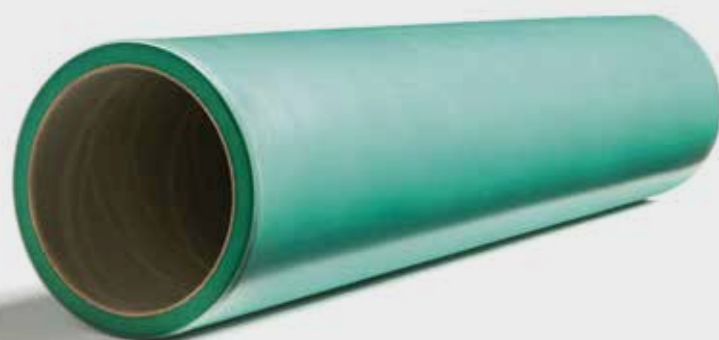
Tuleje gumowe i poliuretanowe