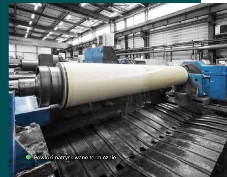
● Powłoki natryskiwane termicznie